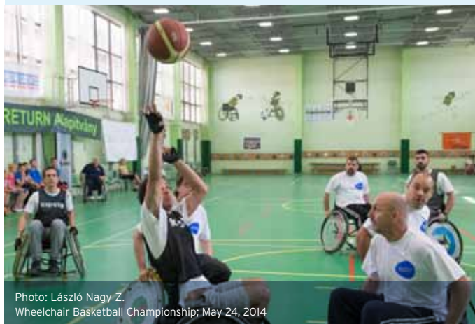
Wheelchair Basketball Championship; May 24, 2014