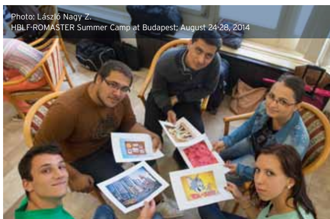
HBLF-ROMASTER Summer Camp at Budapest; August 24-28, 2014

Éppen ez a diákok számára ideális komplexitás jelenti az alapítvány számára a legnagyobb kihívást, mert az 55 fős diáklétszámmal elértük a minőségi teljesítőképesség határát. Mindent elkövetünk, hogy program új finanszírozási forrásokhoz jusson, mert elérkezettünk a HBLF működéséből származó belső támogatás lehetőségeinek határához. Intenzív hazai és külföldi pályázati tevékenységbe kezdünk, hogy a program működtetéséhez új forrásokhoz jussunk, mert egybehangzó szakmai vélemények szerint is a program az alapkonstrukciója, egyedisége révén a roma felzárkóztatás, az értelmiség megerősítésének egyik legfontosabb eszközévé válhat.