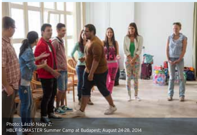
HBLF-ROMASTER Summer Camp at Budapest; August 24-28, 2014

We regard the continued training of our mentors as equally important to internal communication. This year we twice organised a 'Mentor Academy'. The schedule included the discussion and analysis of typical problems with external trainers and the exchange of best practice to attempt to solve conflicts arising from cultural differences. To broaden the mentoring services we would also like to build up a tutor pool.