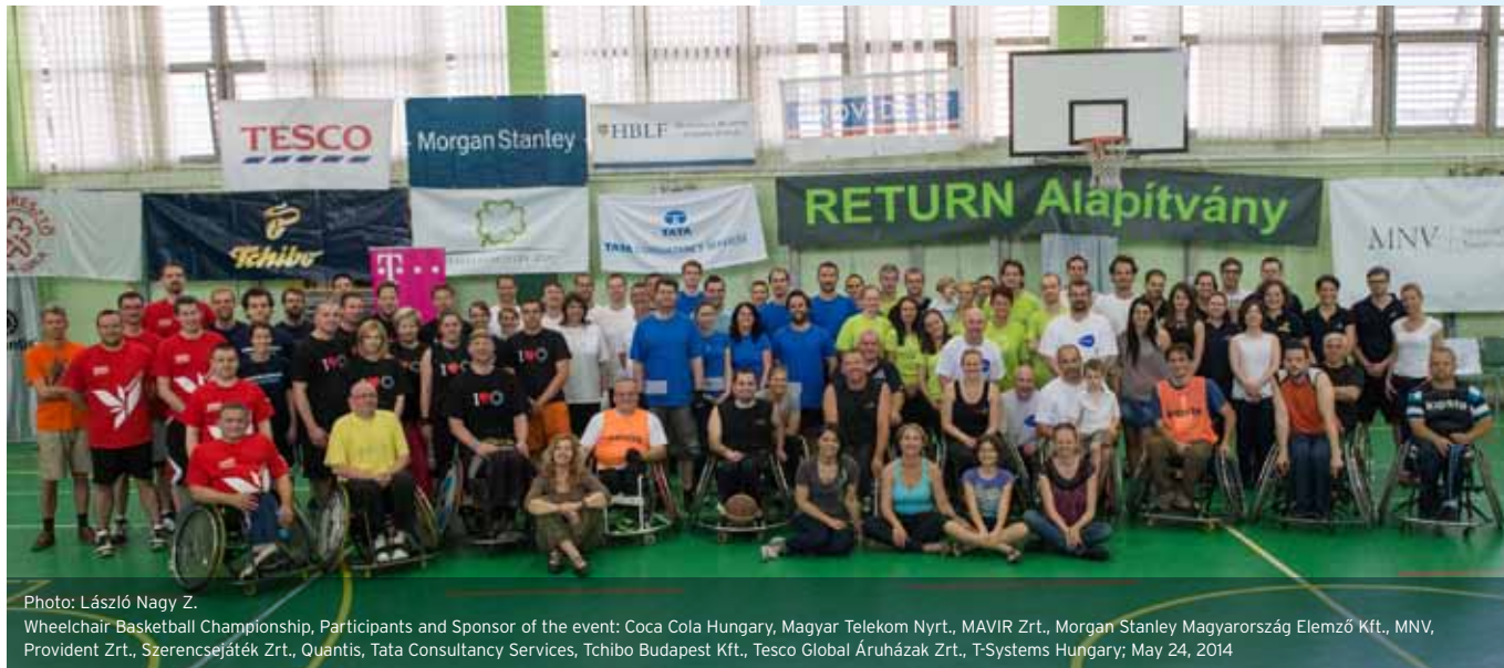
Wheelchair Basketball Championship, Participants and Sponsor of the event: Coca Cola Hungary, Magyar Telekom Nyrt., MAVIR Zrt., Morgan Stanley Magyarország Elemző Kft., MNV, Provident Zrt., Szerencsejáték Zrt., Quánis, Tata Consultancy Services, Tchibo Budapest Kft., Tesco Global Áruházak Zrt., T-Systems Hungary; May 24, 2014