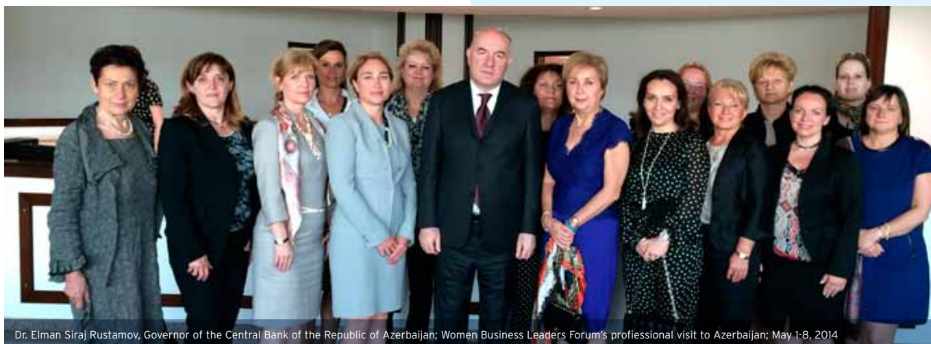
Dr. Elman Siraj Rustamov, Governor of the Central Bank of the Republic of Azerbaijan; Women Business Leaders Forum's professional visit to Azerbaijan; May 1-8, 2014