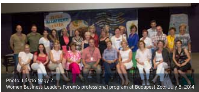
Women Business Leaders Forum's professional program at Budapest Zoo; July 8, 2014