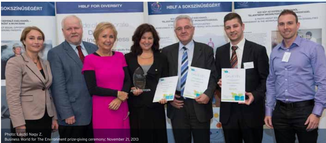
Business World for The Environment prize-giving ceremony; November 21, 2013