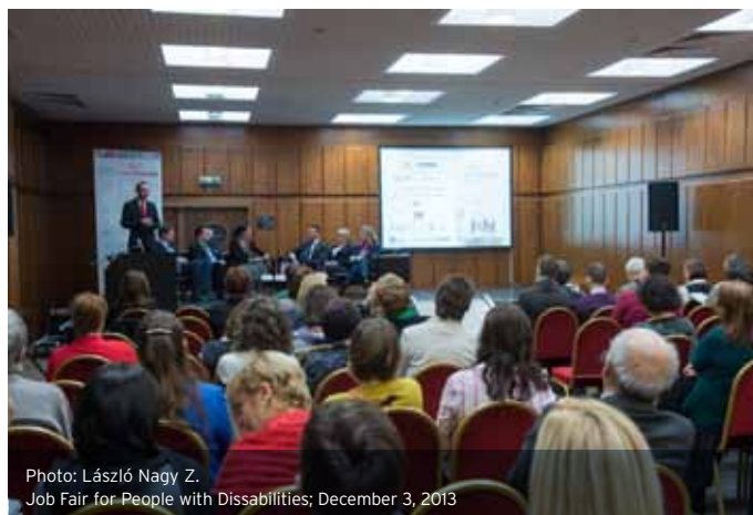
Job Fair for People with Disabilities; December 3, 2013

The selection criteria include their display of diversity, a structured story, qualitative key visual elements and, a new innovation; the variety of views and preferences on Facebook and Youtube. The award ceremony will take place in February 2015, to which everyone is more than welcome! The video competition invitation is available on the www.hblf.hu