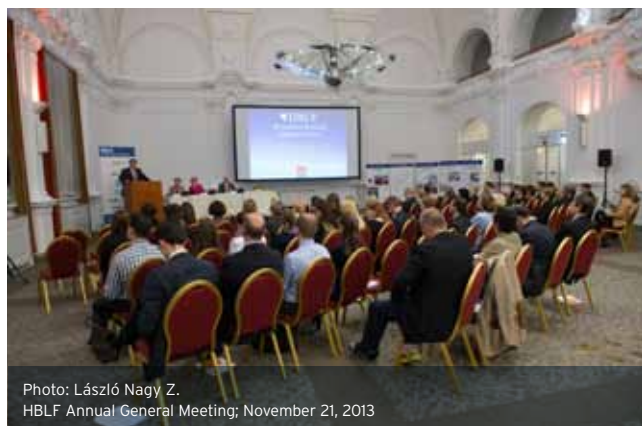
HBLF Annual General Meeting; November 21, 2013