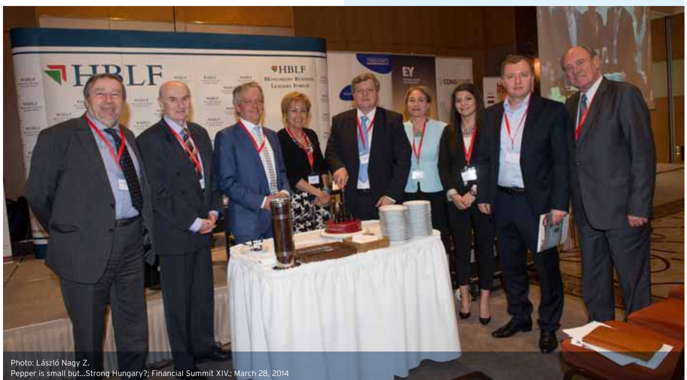
Pepper is small but...Strong Hungary?; Financial Summit XIV.; March 28, 2014