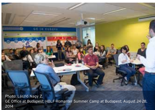
GE Office at Budapest; HBLF-Romaster Summer Camp at Budapest; August 24-28, 2014