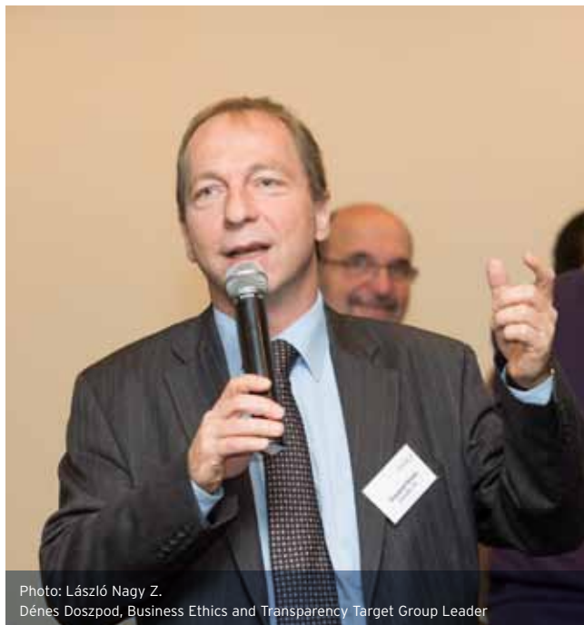
Z. Dénes Doszpod, Business Ethics and Transparency Target Group Leader