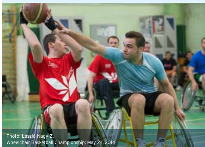
Wheelchair Basketball Championship; May 24, 2014