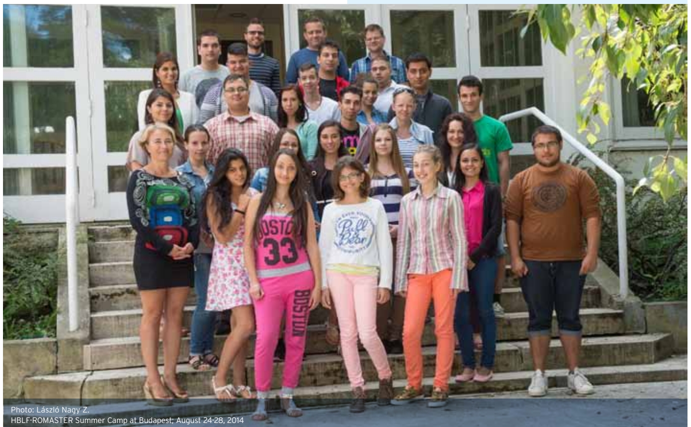
HBLF-ROMASTER Summer Camp at Budapest: August 24-28, 2014

We really appreciate the rise of the mentor capacity of our supporting company. If we convert this to its value equivalent of financial support it would be well in excess of a 24.000Ft/month