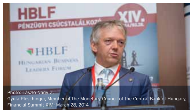
Photo: László Nagy Z. Gyula Pleschinger, Member of the Monetary Council of the Central Bank of Hungary; Financial Summit XIV; March 28, 2014