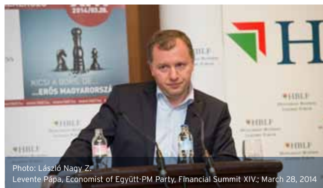
Photo: László Nagy Z. Levente Pápa, Economist of Együtt-PM Party; Financial Summit XIV; March 28, 2014