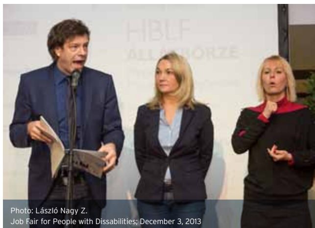
Job Fair for People with Disabilities; December 3, 2013

minősége és egy újítás a szempontok között: nézettség és „like”-ok száma a Facebook-on/Youtube-on. Az ünnepélyes díjátadásra 2015. februárjában kerül sor, ahova minden érdeklődőt szeretettel várunk! A videó pályázati felhívás a www.hblf.hu oldalon érhető el.