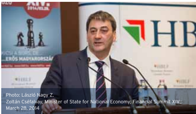
Photo: László Nagy Z. Zoltán Cséfalvay, Minister of State for National Economy; Financial Summit XIV; March 28, 2014