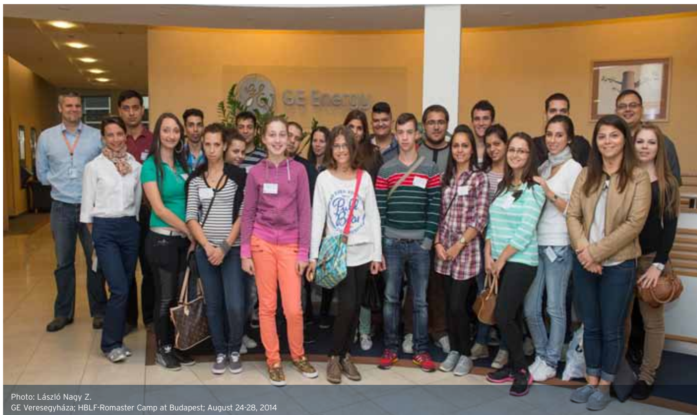
GE Veresegyháza; HBLF-Romaster Camp at Budapest; August 24-28, 2014