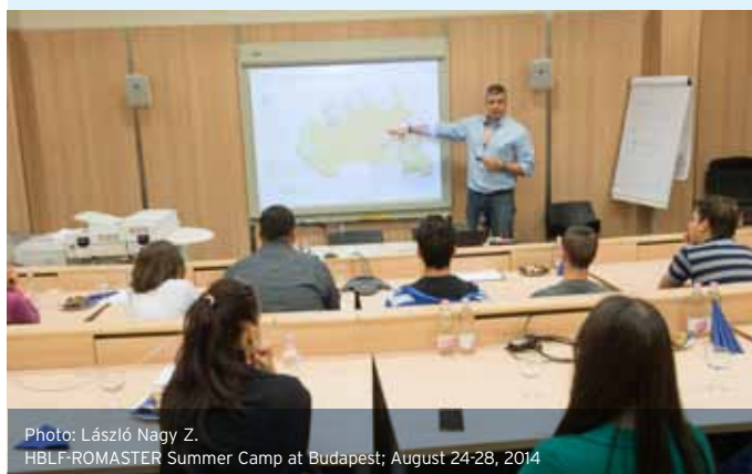
HBLF-ROMASTER Summer Camp at Budapest; August 24-28, 2014

Because of the complexity of this supporting background the Foundation is facing its biggest challenge as, with our 55 students, we have reached the limit of what is qualitatively possible. We do our utmost to find additional funding as we cannot further burden the finances of the HBLF. We must search intensively for additional funding as the program represents - and this claim is based on external professional sources - one of the most important tools with which to strengthen the Roma intelligentsia and accelerate the social integration of this minority. We are trying hard to approach