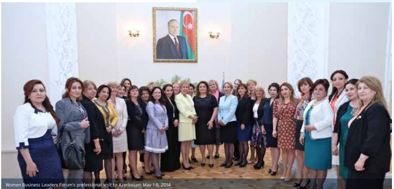
Women Business Leaders Forum's professional visit to Azerbaijan; May 1-8, 2014

Our Women Business Leaders Forum has also had similar success. Formed in the Hungarian Parliament under the auspices of the then-Speaker Katalin Szili, its goal was to initiate a dialogue between key female personalities in business and politics, regardless of their political affiliation, to support the country's long-term sustainable development. When it was first formed, we were able to sit around a large oval table. Now that would be impossible. Our Women Business Leaders Forum consists close to 200 female executives and the number is constantly growing. Over the years, members of our women's forum have actively contributed to the HBLF's work so we could accomplish our mission. A lot of programs have been organized for our members both at home and abroad. Over the years, we visited the President of the Central Bank, the President of the State Audit Office, the President of the Supreme Court and also a number of University Rectors have met our delegations. Our first foreign trip was to London and we also visited the European Parliament in Brussels where we met several Commissioners. This was followed by a visit to Vienna at the invitation of the Ambassador, and we also visited the UN Office. Our next destination was the USA, Washington and New York, where our delegation was