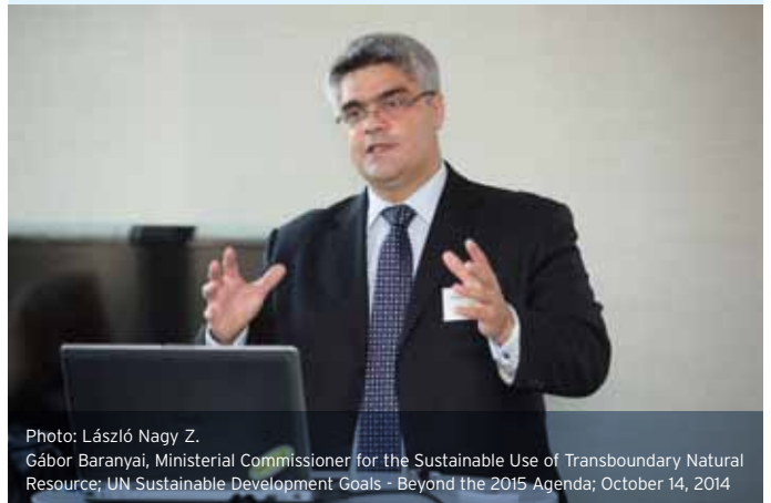
Photo: László Nagy Z. Gábor Baranyai, Ministerial Commissioner for the Sustainable Use of Transboundary Natural Resource; UN Sustainable Development Goals - Beyond the 2015 Agenda; October 14, 2014

current SDGs. He then surveyed the role of stakeholders in SDG development before concluding with an outline of conditions necessary for SDG implementation. Zlinszky explained that the MDGs comprised a mostly social agenda, with the goal of "ensuring a sustainable environment" thrown in for good measure, though without any clear goals related to the global economy. One particular diagram, the so-called Oxfam Doughnut, was used to illustrate the disturbing fact that not a single country in the world exists fully within parameters which provide both a 'safe and just space for humanity' and demonstrate 'inclusive and sustainable economic development'. "Every country is either in the pit or over the cliff," said Zlinszky.