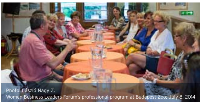
Women Business Leaders Forum's professional program at Budapest Zoo; July 8, 2014