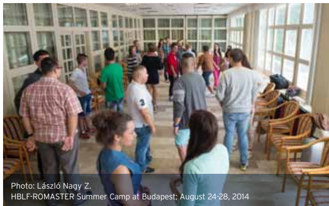
HBLF-ROMASTER Summer Camp at Budapest; August 24-28, 2014

Különösen nagyra becsüljük a támogató vállalatok mentori kapacitásának kiépítését, amelyet, ha materiális támogatásra lefordítanánk, egy sokkal nagyobb összeg jönne ki, mint maga a havi 24.000 Ft pénzbeli juttatás. Ugyanakkor talán éppen ez a közeg adja a támogatók számára a legnagyobb esélyt arra, hogy mélyen azonosuljanak diákjaik folyamatosan változó fejlesztési eszközigényeivel, és optimalizálják a támogatás formáit. Ezzel érzük el leginkább a program egyik legfontosabb mellék célját, a környezeti tudat formálását, a roma értelmiségi szerep fontosságának megértését, mindannyiunk felelősségérzetének erősítését.