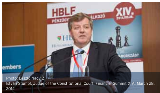
István Stumpf, Judge of the Constitutional Court; Financial Summit XIV; March 28, 2014