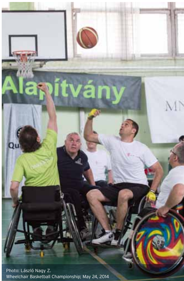
Wheelchair Basketball Championship; May 24, 2014