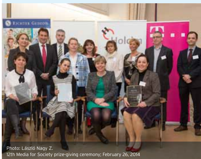
12th Media for Society prize-giving ceremony; February 26, 2014

Thanks to other sponsors, junior education in goalball is now secure, however, the budget for the national adult teams are still rather tight, and further donations would be more than welcome.