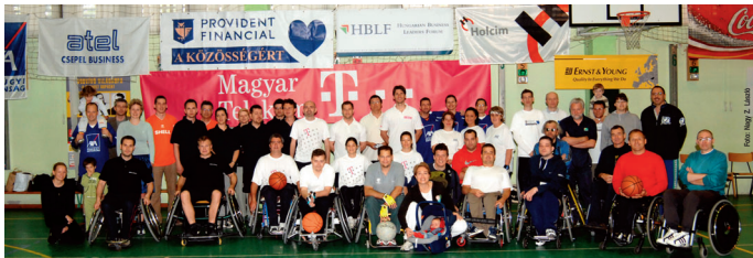
Teams and sponsors: ATEL, Csepeli Áramtermelő Kft., Axa Biztosító Zrt., BMW Magyarország, Coca-Cola Beverages Magyarország Kft., Ernst & Young, Holcim Hungária Zrt., Környezetudatos Vállalatirányítási Egyesület (KÖVEI); Magyar Pályázatkészítő Iroda Kft.; Magyar Telekom Nyrt. (T-Com and T-Mobile); Memotux Kft.; Provident Pénzügyi Zrt.; Shell Hungary Zrt. TESCO-GLOBAL Áruházak Zrt.; Wheelchair Basketball Championship; May 5, 2007

Through its extensive access to senior business executives, HBLF mobilises business in both action and leadership in responsible business practices. The Financial Summit series are so successful in creating positive social and professional dialogue about the reforms, that we are organising the next event in August. The Women Business Leaders