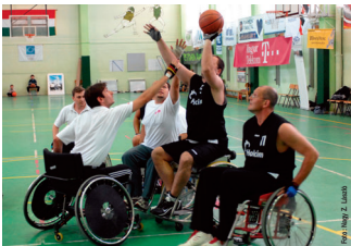
The Holcim Team in action; Wheelchair Basketball Championship; May 5, 2007

Both the personal engagement as well as the financial support will also be needed in the years to come. The work of HBLF is not ended, it is permanently developing according to the new challenges to Hungarian society and economy. The management of HBLF is committed to identifying those upcoming issues in time in order to keep HBLF always firmly on the top position it has acquired over the past years. With your contribution we will together ensure that HBLF will not only be proud of a great past but can also look into a splendid future.