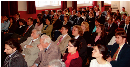
Stern Conference; March 28, 2007

Az I. Fórum nyíltében olyan hiszem, hogy a Stern Review olyan jelentős dokumentum, amelynek alapelveit minden