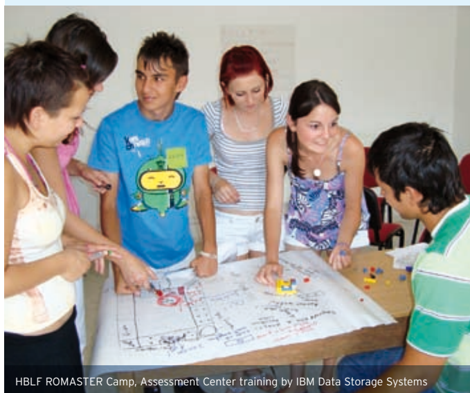
HBLF ROMASTER Camp, Assessment Center training by IBM Data Storage Systems