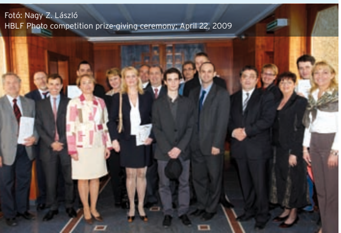
HBLF Photo competition prize-giving ceremony; April 22, 2009

3. Another major milestone among our programmes is the creation of a „Work-life balance toolkit” , which elaborates on and provides guidance about such actual issues as: „Teleworking”, „Outplacement”, „How to prepare and equal opportunity plan?”, „Maternity leave”, „Equal opportunity in practice”, all this in a simple, understandable one pager format. Concerning maternity leave, we organised a round table discussion on November 20, focusing on „Work and /or family?”. Our primary target was to establish the framework of a dialogue for all related participants of the discussion ranging from HR professionals, business leaders, representatives, to employees concerned. In addition, a proposal was compiled summarising ways and ideas both how to make corporations more accepting and attractive for women on maternity leave, and how they can stay competitive in the labour market. These useful tips are available for not only HBLF members, but for the public as well on the HBLF website.