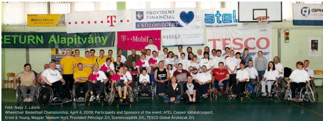
Wheelchair Basketball Championship; Ápril 4, 2009; Participants and Sponsors of the event: ATEL Csepeli Vállalatcsoport, Ernst & Young, Magyar Telekom Nyrt, Provident Pénzügyi Zrt, Szerencsejáték Zrt., TESCO Global Áruházak Zrt.