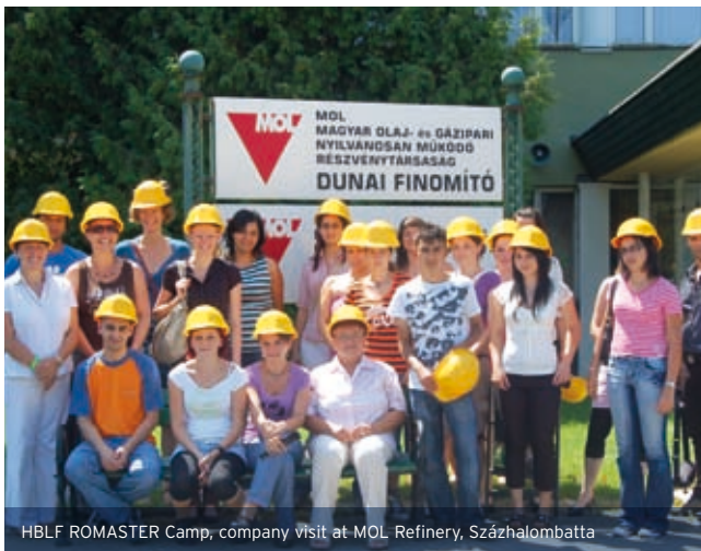
HBLF ROMASTER Camp, company visit at MOL Refinery, Százhalombatta

Nézzünk magunkba; hányan fogtunk már kezét egy cigánygyerekkel, hányan kérdeztünk meg életünkben egy szimpátiára vágyó cigány fiatalról, hányan kerültük már a találkozást egy cigány külsejű felnőttel, hányan választottunk olyan lakhelyet, ahol kevés vagy nincs is cigány? Természetes, hogy sokan nem kerültünk még a felsoroltakhoz hasonló élethelyzetbe, de hányan gondolkodtunk el saját hozzájárulásunk formájáról, hogy a törésvonal átjárható legyen? Teljesen tiszta a lelkiismeretünk, hogy mindent elkövetünk a gyerekeink társadalmát fenyegető etnikai robbanás hatásainak megelőzéséért, a kölcsönös befogadásért? Azt egyre inkább érezzük, hogy a kérdés felvetése nem egyszerű moralizálás, utódaink a