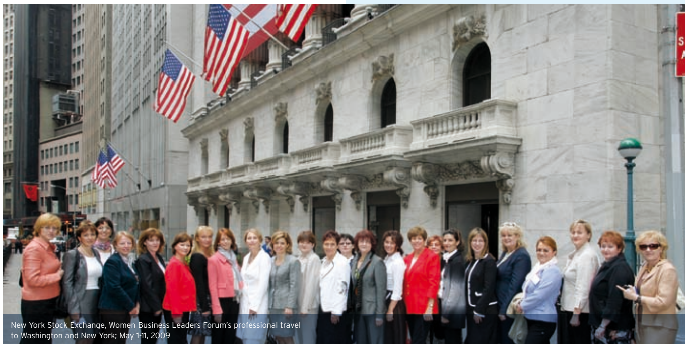
New York Stock Exchange, Women Business Leaders Forum's professional travel to Washington and New York; May 1-11, 2009

Our professional program started on the morning of Monday May 4, with a visit to the Headquarters of the Department of Defence, the Pentagon , one of the world's largest office buildings. We had a professional tour through the building itself where we were happy