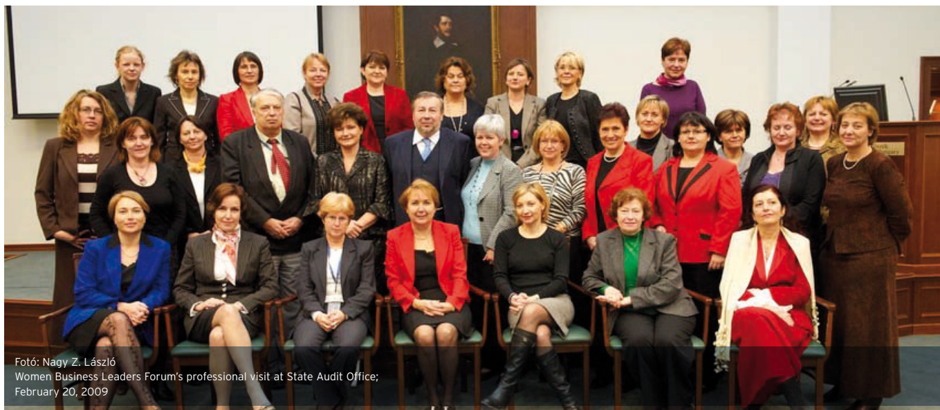
Women Business Leaders Forum's professional visit at State Audit Office; February 20, 2009

A HBLF környezetvédelmi és fenntarthatósági munkacsoportja elsőként hívta fel tagjai figyelmét, hogy csatlakozzanak a Koppenhágai Kiáltványhoz (Copenhagen Communiqué), melyet alapítónk Károly herceg vállalatvezetői csoportja hívott életre. A kezdeményezés célja, hogy a vállalati vezetők közösen és globális szinten próbálják pozitív irányban befolyásolni a decemberi koppenhágai konferencia tárgyalásait. A MOL magyar olajtársaság nemzetközi vállalként vezető szerepet vállalt e globális kezdeményezésben.