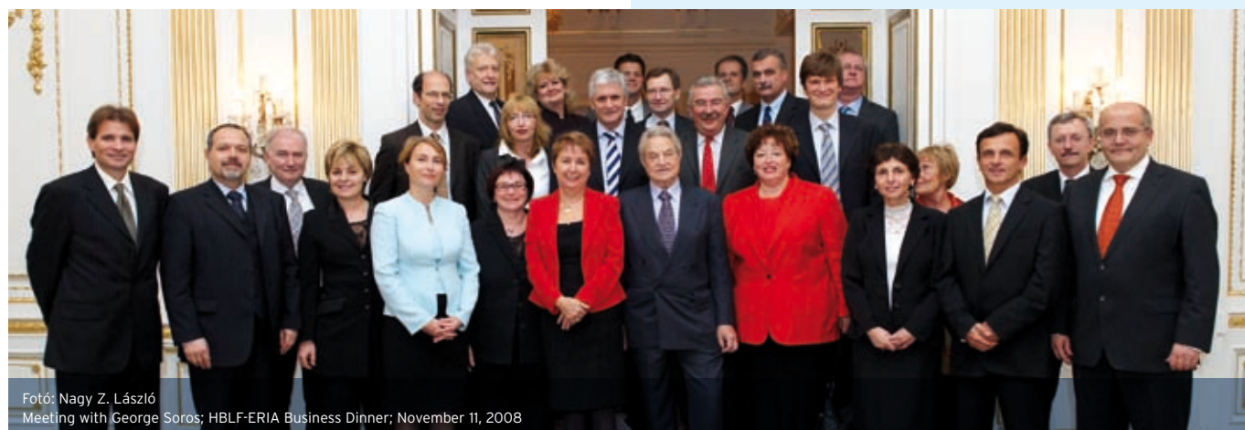
Meeting with George Soros; HBLF-ERIA Business Dinner; November 11, 2008

Through our business ethics and transparency workgroup, we asked our members to do a quick test on corporate governance which provides us with information on transparency and responsible corporate processes. Over the first half of next year, we are personally going to visit the companies which wish to highlight their