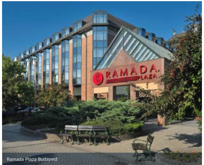
Ramada Plaza Budapest

are available to ensure perfect relaxation for exhausted business woman.)