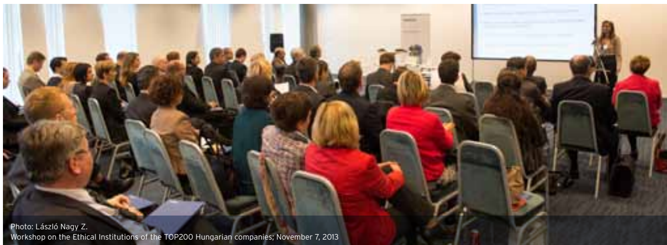
Workshop on the Ethical Institutions of the TOP200 Hungarian companies; November 7, 2013