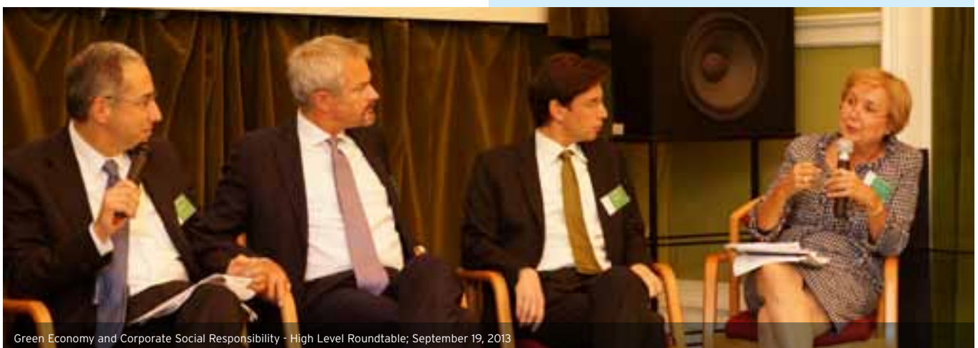
Green Economy and Corporate Social Responsibility - High Level Roundtable; September 19, 2013