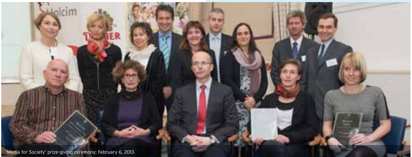
'Media for Society' prize-giving ceremony; February 6, 2013

Environment and Sustainability Target Group Leader