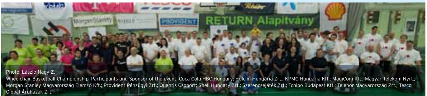
Wheelchair Basketball Championship, Participants and Sponsor of the event: Coca Cola HBC Hungary; Holcim Hungária Zrt.; KPMG Hungária Kft.; MagiCom Kft.; Magyar Telekom Nyrt.; Morgan Stanley Magyarország Elemző Kft.; Provident Pénzügyi Zrt.; Quantis Csoport; Shell Hungary Zrt.; Szerencsejáték Zrt.; Tchibo Budapest Kft.; Telenor Magyarország Zrt.; Tesco Global Áruházak Zrt.

In the spirit of number '3', this year was the third time that we organised the Give & Gain Day, which is supposed to strengthen the culture of volunteering and to promote partnership within sectors. In 2013, 770 colleagues from 21 companies did volunteer work with the involvement of 71 cooperating civil partners. This year, our initiative was also supported by many non-HBLF companies which had neither the experience nor civil contacts to implement such a program. For the first time this year, we found recipient civil partners for them to introduce corporate volunteering. The