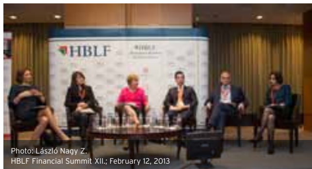
HBLF Financial Summit XII.; February 12, 2013