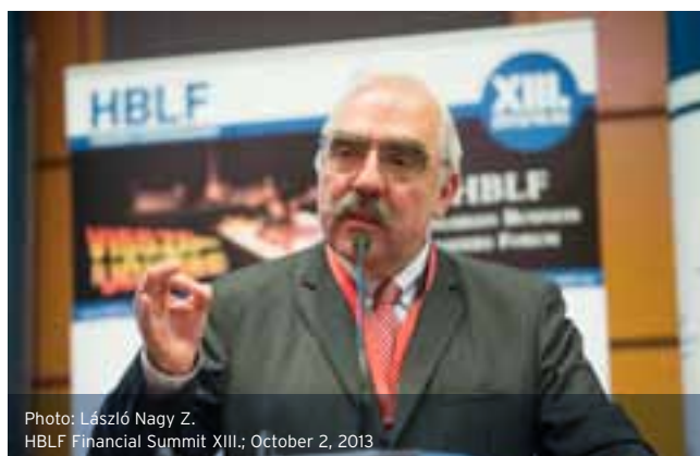
HBLF Financial Summit XIII.; October 2, 2013