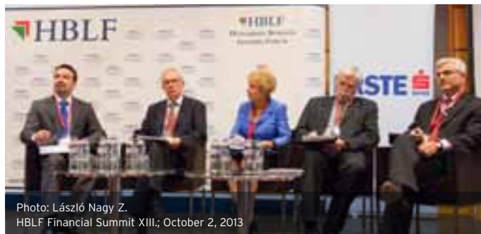
HBLF Financial Summit XIII.; October 2, 2013