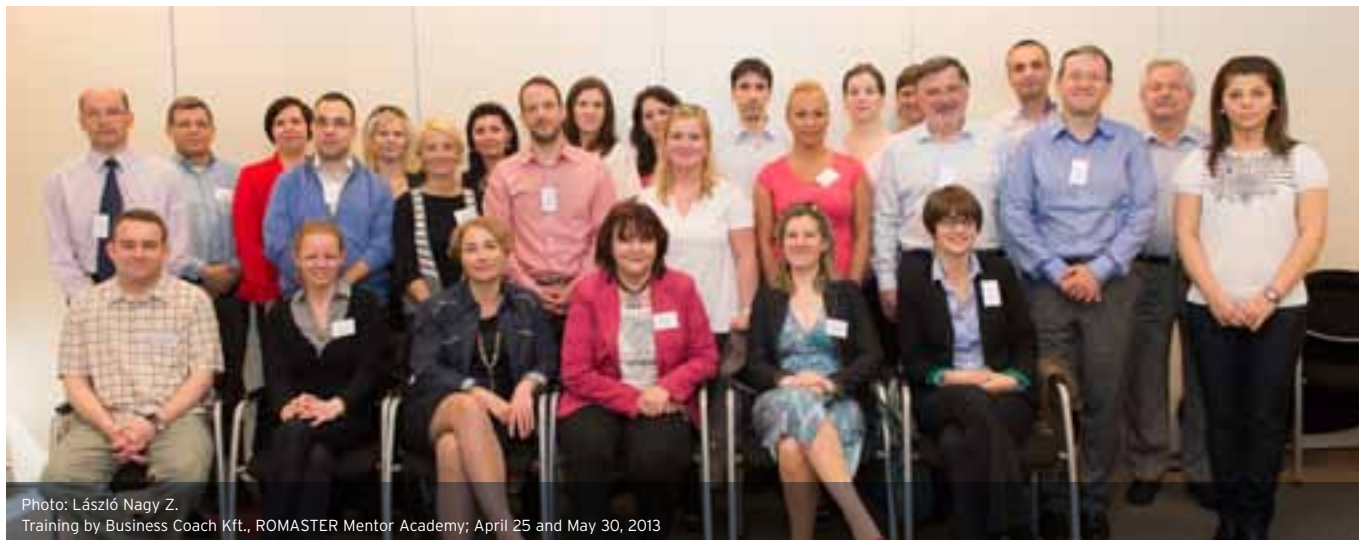
Training by Business Coach Kft., ROMASTER Mentor Academy; April 25 and May 30, 2013