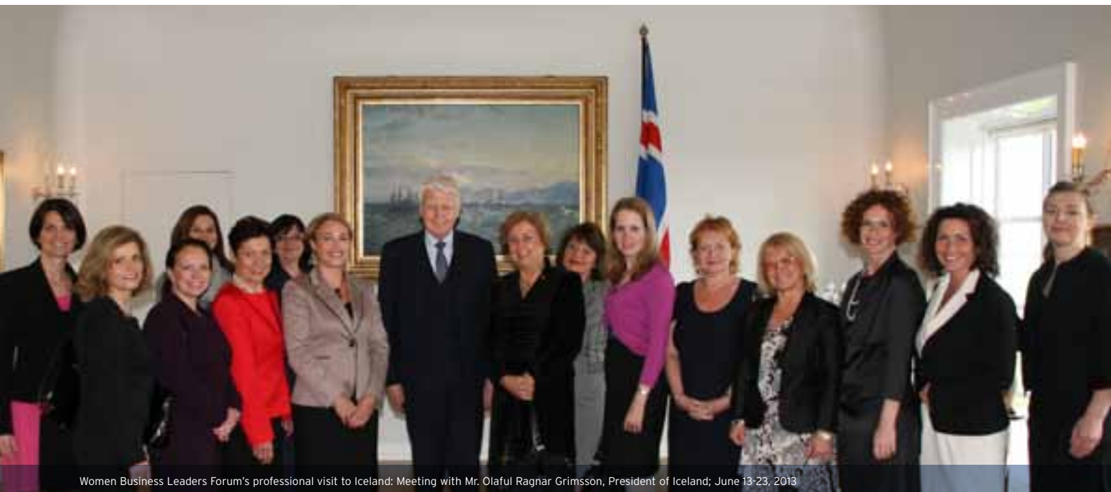
Women Business Leaders Forum's professional visit to Iceland: Meeting with Mr. Olafur Ragnar Grimsson, President of Iceland; June 13-23, 2013

A HBLF ÉVENTE MEGJELENŐ KIADVÁNYA THE ANNUAL JOURNAL OF THE HBLF