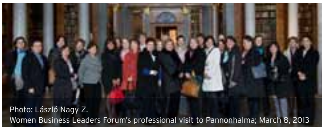
Women Business Leaders Forum's professional visit to Pannonhalma; March 8, 2013