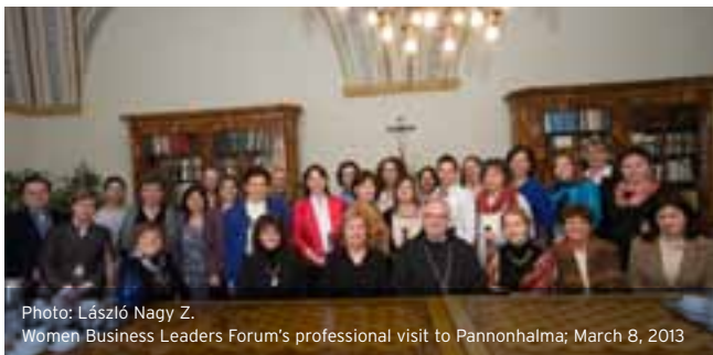
Women Business Leaders Forum's professional visit to Pannonhalma; March 8, 2013