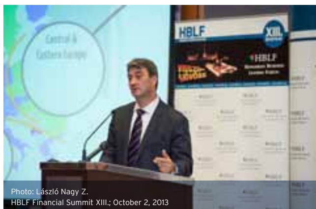
HBLF Financial Summit XIII.; October 2, 2013