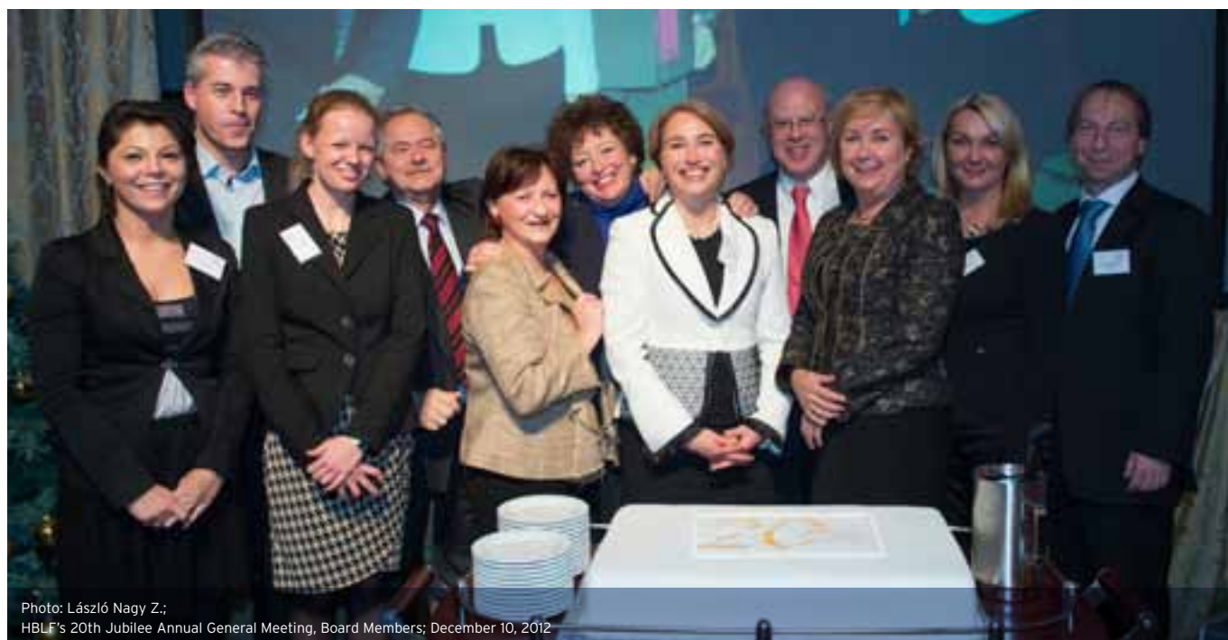
HBLF's 20th Jubilee Annual General Meeting, Board Members; December 10, 2012