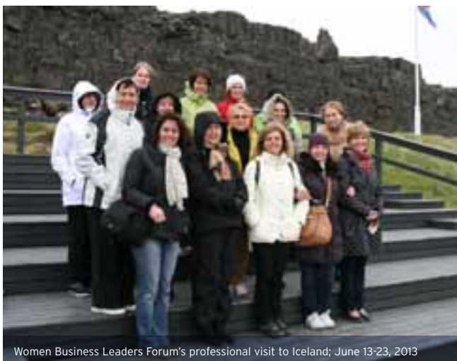
Women Business Leaders Forum's professional visit to Iceland; June 13-23, 2013