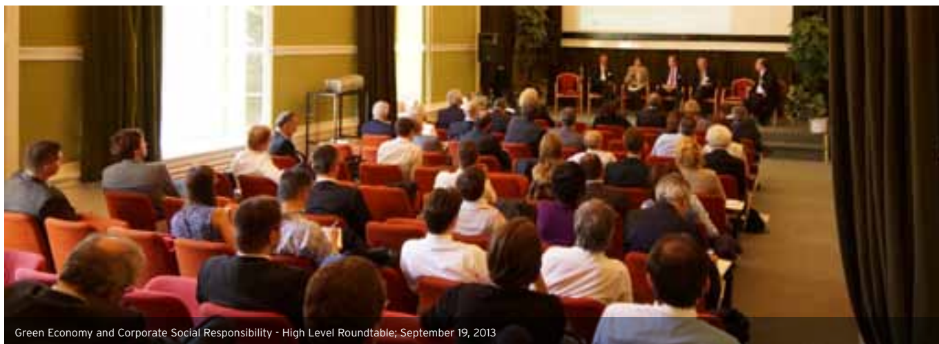
Green Economy and Corporate Social Responsibility - High Level Roundtable; September 19, 2013