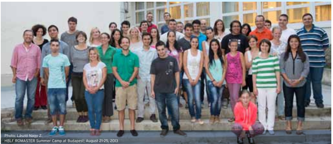
HBLF ROMASTER Summer Camp at Budapest; August 21-25, 2013

The HBLF-ROMASTER Foundation organised a summer camp between 21 and 25 August 2013, and I also had the chance to attend this event. We stayed at Hotel Római, in Budapest. I must confess, I was a bit excited about what was coming up as this was my second camp, and I did not know most of the participants. Before the camp I checked the schedule and I liked what I saw. When we arrived at the venue, I met a lot new students, and realised I had already met some of them before. It was nice to see the ones I met