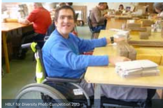
HBLF for Diversity Photo Competition 2013

The Job Fair does not stand on its own in our line of innovative programs. Two of the programs planned for the leaders mentioned by our President - Hard Talk with well-known personalities and the HBLF CEO Forum - were launched this year.