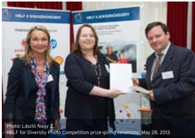
HBLF for Diversity Photo Competition prize-giving ceremony; May 28, 2013