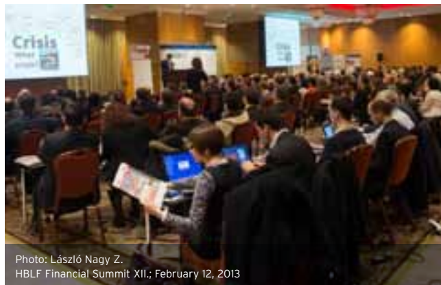
HBLF Financial Summit XII.; February 12, 2013