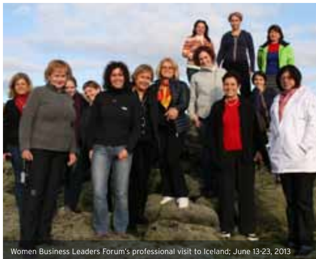
Women Business Leaders Forum's professional visit to Iceland; June 13-23, 2013

Szintén harmadik alkalommal hirdettük meg Sokszínűségi Fotópályázatunkat, mely idén két témában várta a fotókat: szülőként a munkában és teljesítmény megváltozott munkaképességgel. 60 pályaműből válogattott a független elismert szakembereket felsoportozató zsűri.