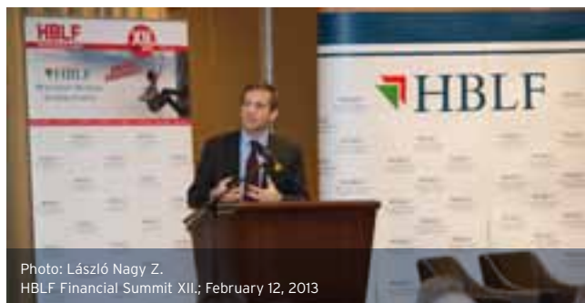
HBLF Financial Summit XII.; February 12, 2013