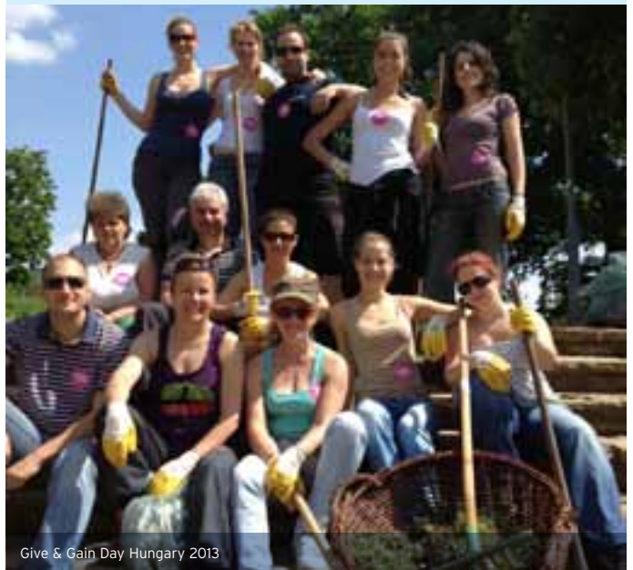
Give & Gain Day Hungary 2013

new partnerships and helps where it is most needed. Last but not least employees can also benefit, volunteering improving existing capabilities and skills, giving inspiration and impetus, and helping in team building.