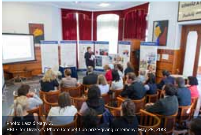
HBLF for Diversity Photo Competition prize-giving ceremony; May 28, 2013