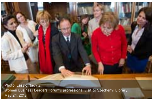
Women Business Leaders Forum's professional visit to Széchenyi Library; May 24, 2013