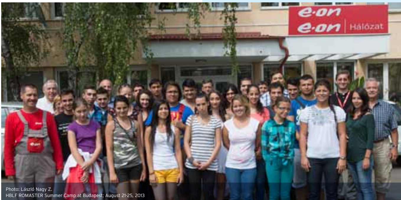
HBLF ROMASTER Summer Camp at Budapest; August 21-25, 2013

Következő napon Székesfehérvárra utaztunk egy külön busszal. Az E.ON céget látogattuk meg, ahol bemutatták nekünk például az ügyfélszolgálati irodát az üzemirányítási központot és az irányító helyiséget. Itt is külön csoportokban vezettek körül mindenkit és a cég biztosította az ebédünket is.