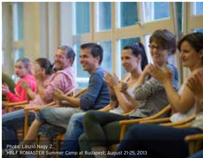
HBLF ROMASTER Summer Camp at Budapest; August 21-25, 2013

in the first camp and we had a good chat. I liked the hotel, sharing my room with two new girls and becoming friends.