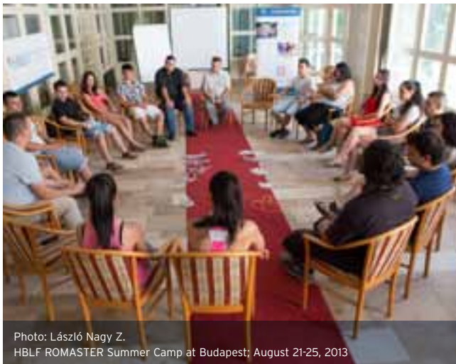
HBLF ROMASTER Summer Camp at Budapest; August 21-25, 2013

Később a Momentán Társulat csapatépítő tréningjén vettünk részt, ahol nagyon sokat nevetett mindenki és e tréning során még inkább kezdtem megismerni újabb embereket. Következő napon a Morgan Stanley pénzügyi oktatásán vehettünk részt ahol rengeteg dolgot megtudhattunk a családi költségvetéssel és pénzügyekkel, illetve hitelekkel kapcsolatban.