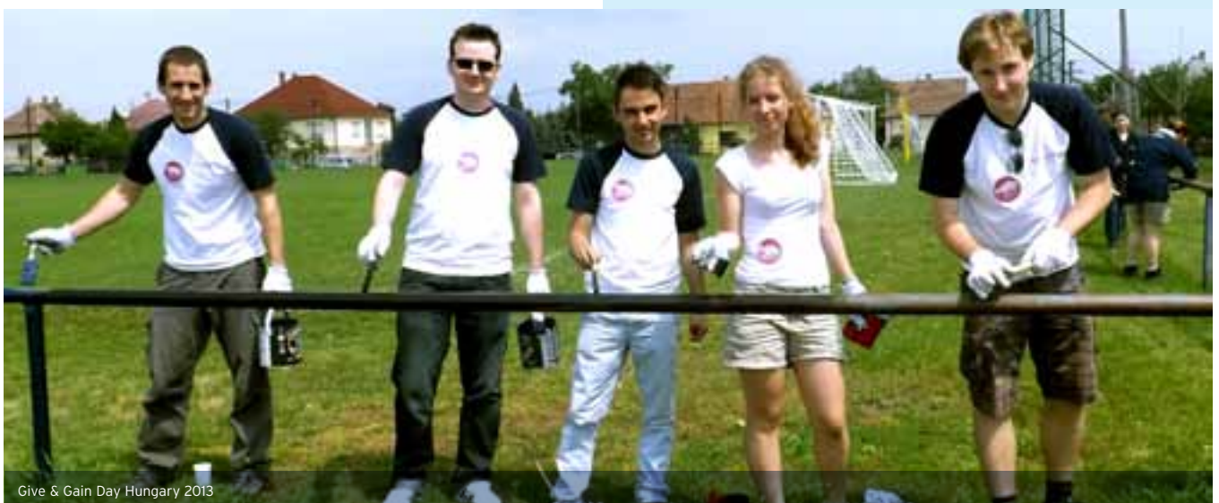
Give & Gain Day Hungary 2013