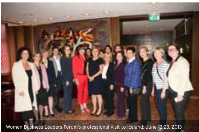
Women Business Leaders Forum's professional visit to Iceland; June 13-23, 2013