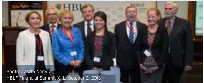
HBLF Financial Summit XIII.; October 2, 2013

In 2013, following the worthy celebration of twenty years, we continued the outstanding professional activities of our target groups. This year we have organised 16 successful events, often with more than 100 participants, and 5 more events are still to come. Our target groups were even more active and they have had 20 meetings this year. Our traditional programs were also continued this year, and we have launched new and innovative initiatives, as well.