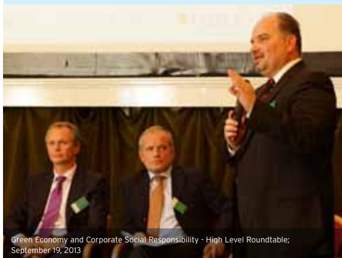
Green Economy and Corporate Social Responsibility - High Level Roundtable; September 19, 2013

European Commissioner, László Andor in his video addressed some of the key challenges which Europe faces in making a successful transition to a green economy. ‘It is undoubtedly true that there are many companies implementing responsible environmental practices.’ The Commissioner added that ‘the transition towards a green economy requires the commitment of both public and private actors, as well as civil society.’