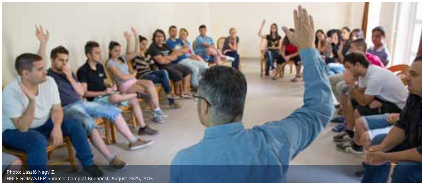
HBLF ROMASTER Summer Camp at Budapest; August 21-25, 2013