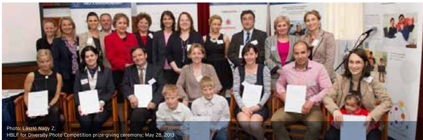
HBLF for Diversity Photo Competition prize-giving ceremony; May 28, 2013

A pályázatra beérkezett legjobb tizenöt képből a HBLF a Sokszínűségért HR munkacsoportja - az előző évekhez hasonlóan - vándorkiállítást rendezett. A képek a vándorkiállítás keretében egy éven keresztül tekinthetők meg a pályázó vállalatoknál, és más, érdeklődő cégek székhelyein, valamint további esélyegyenlőségi rendezvényeken, konferenciákon. Egy másik újításunk, hogy - környezetbarát módon - a kiállított képeket elektronikus kiadvány formájában jelentettük meg, így minden érdeklődő számára elérhetőek a HBLF honlapján.