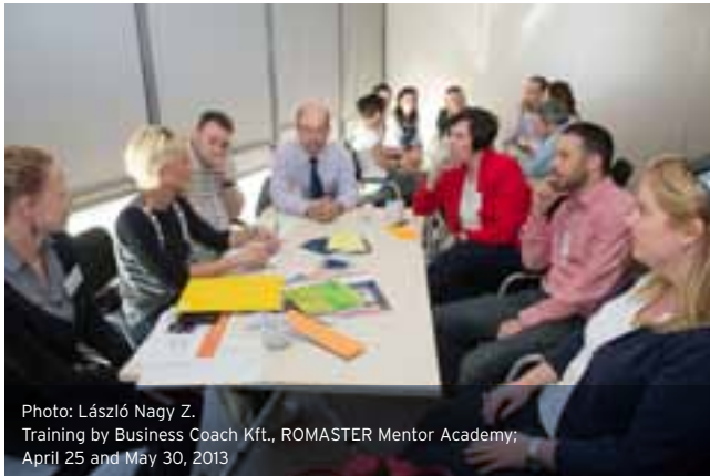
Training by Business Coach Kft., ROMASTER Mentor Academy; April 25 and May 30, 2013

Idei ötnapos nyári táborunk keretében többek közt volt improvizációs csapatépítő tréning a Momentán Társulattal, a diákok pályaaorientációs mérésen vettek részt a Báránnyelvi Alapítvány szervezésében, pénzügyi oktatást tartottak nekik a Morgan Stanley kollégái,