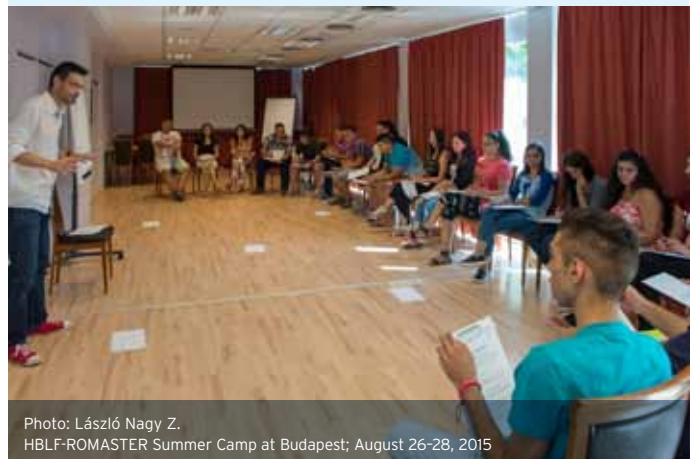
HBLF-ROMASTER Summer Camp at Budapest; August 26-28, 2015