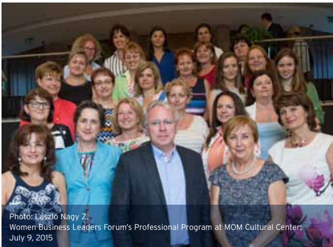
Women Business Leaders Forum's Professional Program at MOM Cultural Center; July 9, 2015