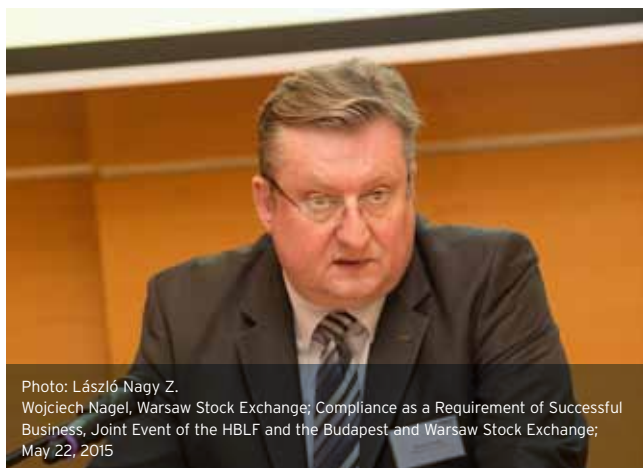
Z. Wojciech Nagel, Warsaw Stock Exchange; Compliance as a Requirement of Successful Business, Joint Event of the HBLF and the Budapest and Warsaw Stock Exchange; May 22, 2015