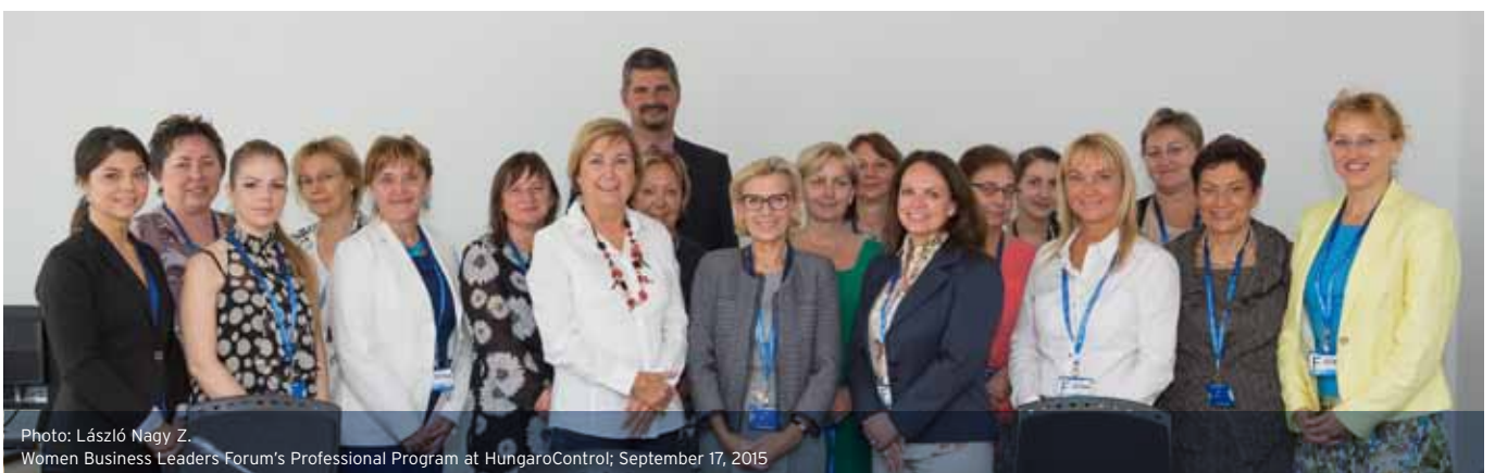
Women Business Leaders Forum's Professional Program at HungaroControl; September 17, 2015