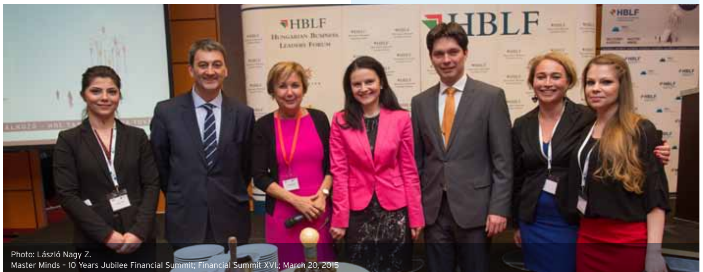
Master Minds - 10 Years Jubilee Financial Summit; Financial Summit XVI; March 20, 2015

I wish all our Members, Partners and Sponsors a very peaceful and Merry Christmas and a lot of success in the New Year.