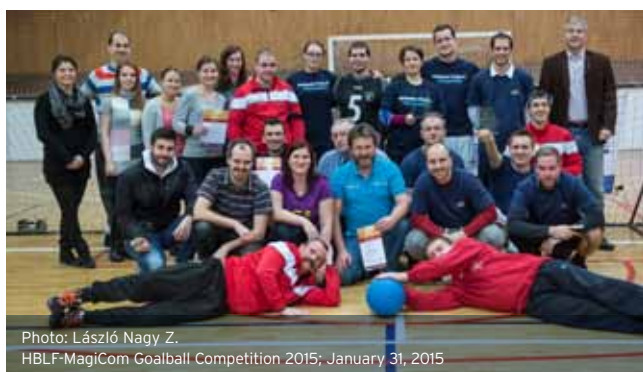
HBLF-MagiCom Goalball Competition 2015; January 31, 2015

Az évek óta „visszajáró” cégek mellett új csapatok is neveztek. Volt olyan tagvállalat, amely pusztán a nevezési díj befizetésével támogatta a kezdeményezést. Némely csapat hosszú kispaddal érkezett, nekik nagyobb esélyük volt a végső győzelem elérésére. A nyolc indulóra tekintettel a körmérkőzések sorsolása alapján mindegyik csapat legalább három mérkőzést játszhatott a nap folyamán.