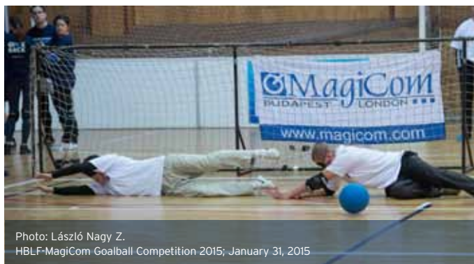
HBLF-MagiCom Goalball Competition 2015; January 31, 2015