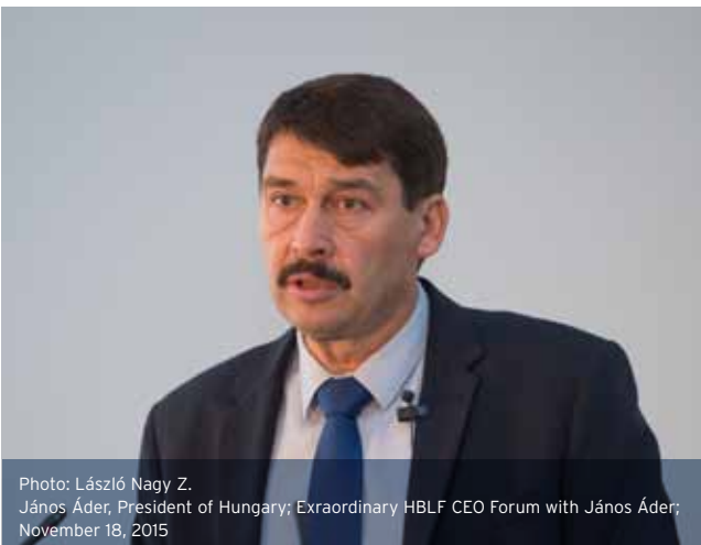
János Áder, President of Hungary; Extraordinary HBLF CEO Forum with János Áder; November 18, 2015