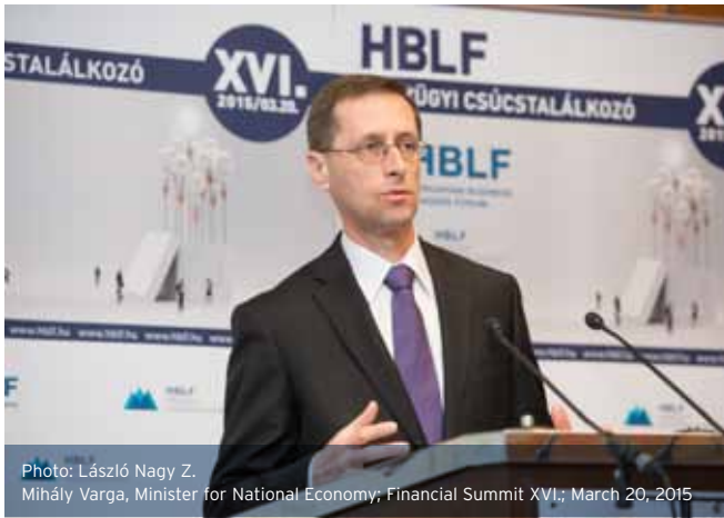
Photo: László Nagy Z. Mihály Varga, Minister for National Economy; Financial Summit XVI.; March 20, 2015