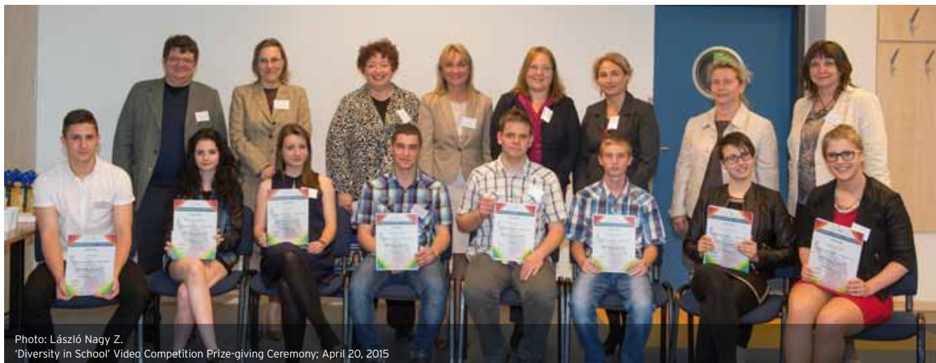
'Diversity in School' Video Competition Prize-giving Ceremony; April 20, 2015

a vállalatokat egy költséghatékonyabb és a munkavállalók igényeit jobban figyelembe vevő javadalmazási rendszer kialakításában. A Vodafone Magyarországnál megtekintettük a Ready Business Zone-t, ahol a legmodernebb vállalati kommunikációs eszközöket, módszereket és csatornákat mutatták be a munkacsoport tagoknak. Az utóbbi két munkacsoport ülésen elkezdjük a 2016-os év fő irányvonalának kijelölését, s körvonalazódott olyan aktuális téma, amikre fókuszálni szeretnénk, mint például a Talent Management. 2016-ban célunk továbbra is az, hogy a HR Munkacsoport magas szakmai felkészültséggel és elkötelezettséggel aktívan támogassa a tagvállalatok sokszínűségi és befogadási gyakorlatát, megosztva a legjobb vállalati példákat, valamint ösztönözze a tagvállalatokat, hogy minél többen próbáljanak ki és alkalmazzanak innovatív eszközöket, módszereket a vállalati sokszínűség és befogadás témakörében.