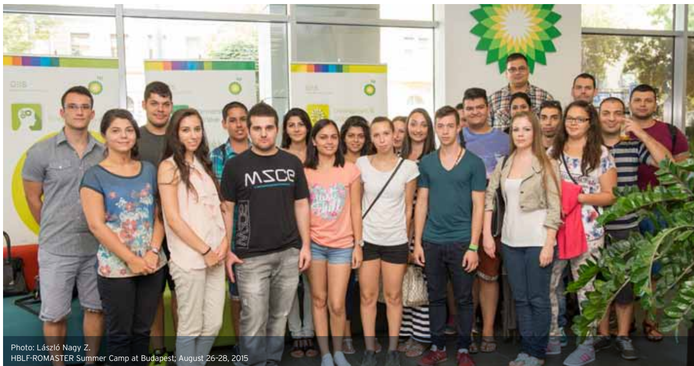
HBLF-ROMASTER Summer Camp at Budapest; August 26-28, 2015

Szeretnénk a jövőben erősíteni a támogatott diákok családjával is a kapcsolatot. Biztos, hogy ezek a személyes találkozások könnyíteni fogják diákjaink számára azt, hogy közvetlen családi és társadalmi környezetük könnyebben tudjon a diák távlati céljaival azonosulni. A ROMASTER Alumni folyamatos fejlesztésével is erősítjük a támogatott diákok összetartozás érzését, közösségi elkötelezettségét. Rendszeresen bevonjuk diplomás diákjainkat a Nyári Táborok programjaiba, fontosnak tartjuk, hogy példájuk sokakat ösztönözzön hasonló életútra. Többen igazolták, hogy a Program a pénzügyi és mentális alapok megteremtésén túlmenően a közösségi események, találkozások révén jelentősen befolyásolta személyiségfejlődésüket is. Fontosnak tartjuk, hogy diákjaink a korosztályukat jellemző közvetlenséget, kötetlenséget, felszabadságot is megismerjék, élvezzék a közösség erejét és értékeit az úgynevezett „tematikus-didaktikus” programok mellett. Arra, hogy ez a törekvésünk többnyire sikerrel jár, legyenek példák a két diákunktól származó, az idei nyári tábor értékelésében szereplő idézetek: