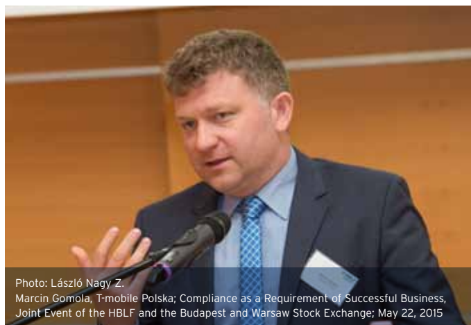
Photo: László Nagy Z. Marcin Gomola, T-mobile Polska; Compliance as a Requirement of Successful Business, Joint Event of the HBLF and the Budapest and Warsaw Stock Exchange; May 22, 2015