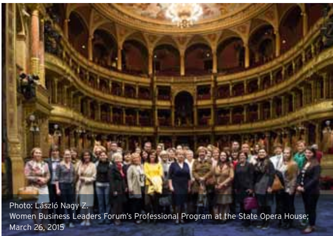
Women Business Leaders Forum's Professional Program at the State Opera House; March 26, 2015