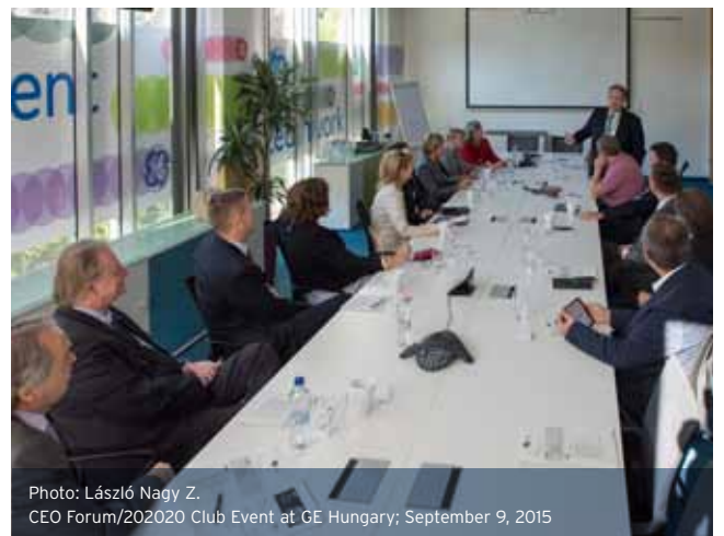
CEO Forum/2020 Club Event at GE Hungary; September 9, 2015