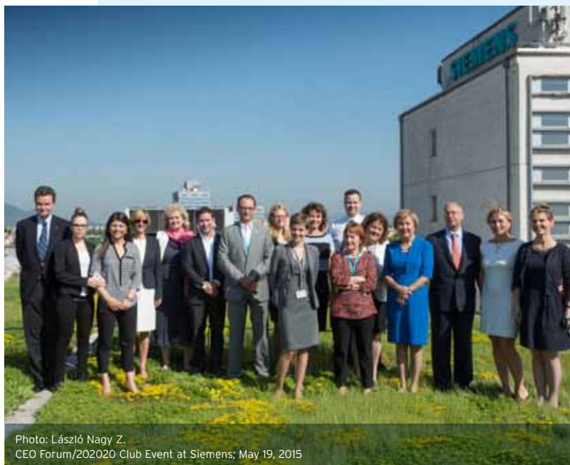
CEO Forum/2020 Club Event at Siemens; May 19, 2015