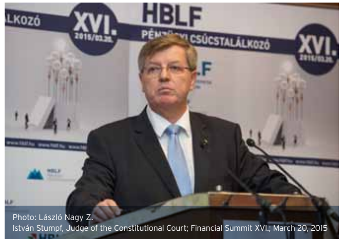
István Stumpf, Judge of the Constitutional Court; Financial Summit XVI.; March 20, 2015