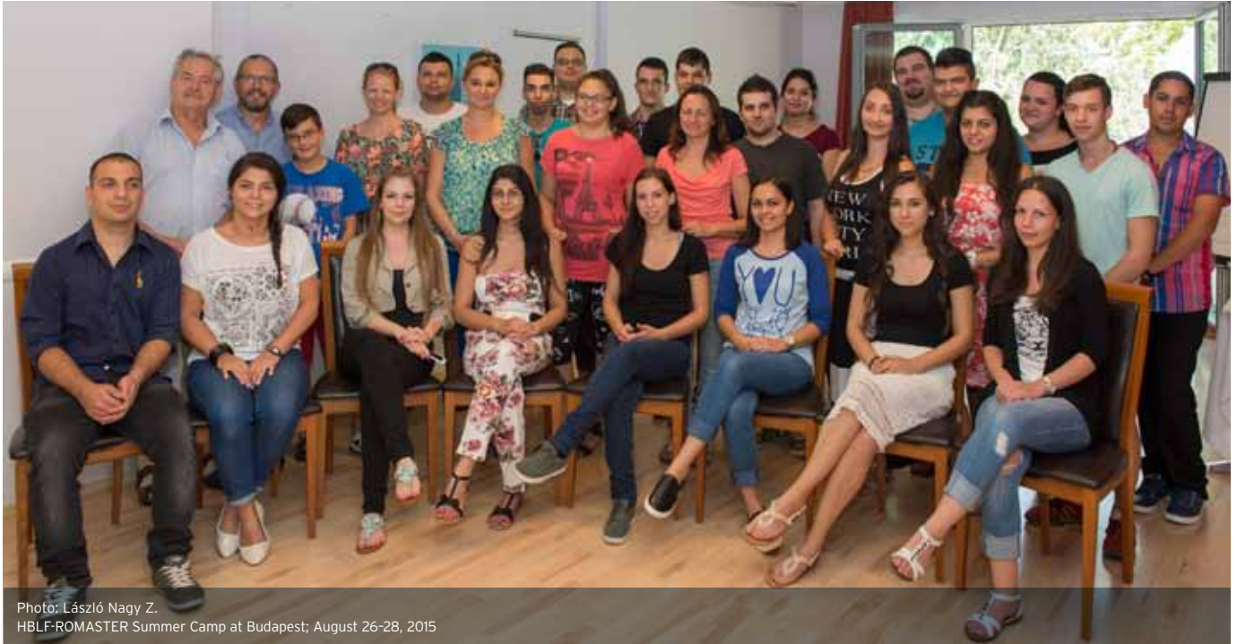
HBLF-ROMASTER Summer Camp at Budapest; August 26-28, 2015

Raiffeisen Bank, SAP Hungary Kft., Shell Hungary Zrt., Telenor Magyarország, TIGÁZ.