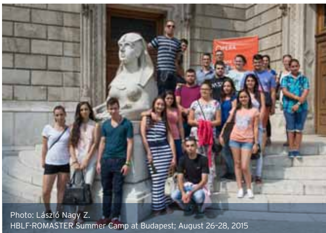
HBLF-ROMASTER Summer Camp at Budapest; August 26-28, 2015

We put more emphasis on the continuous evaluation and assessment of role and work of the mentors as well as on processing their feedback. There is a big difference in the evaluation of the mentors by the students: almost all of them have different ideas on the catalyst role and support to be provided by the mentors. Our trainings for the mentors serve the purpose of creating a single, united attitude and practical foundations. This year the program of the Mentor Academy