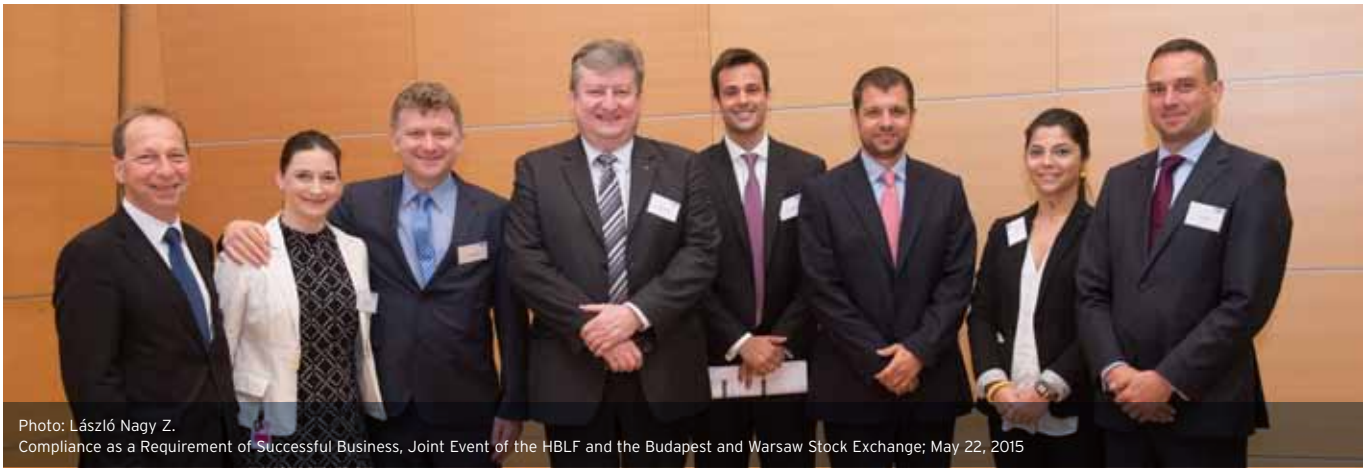
Compliance as a Requirement of Successful Business, Joint Event of the HBLF and the Budapest and Warsaw Stock Exchange; May 22, 2015