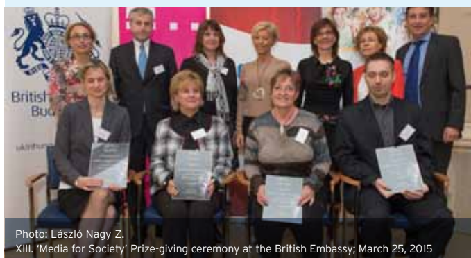
XIII. 'Media for Society' Prize-giving ceremony at the British Embassy; March 25, 2015

Besides the 'regulars' who return year on year, newly joining companies also entered. Some companies supported the event by paying the entry fee only. Some teams arrived with a long list of replacement on the bench, and they had better chances to reach victory. Eight teams entered the tournament, and after drawing lots, all of them could play at least three matches during the day.