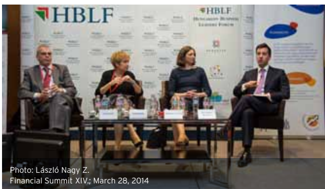
Financial Summit XIV; March 28, 2014