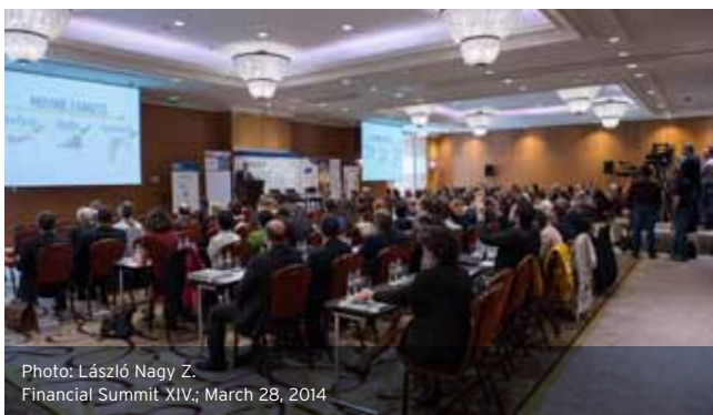
Financial Summit XIV; March 28, 2014