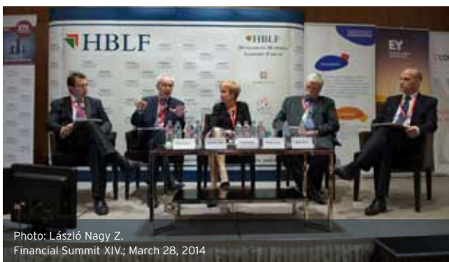
Financial Summit XIV; March 28, 2014