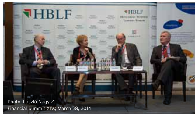
Z. Financial Summit XIV; March 28, 2014