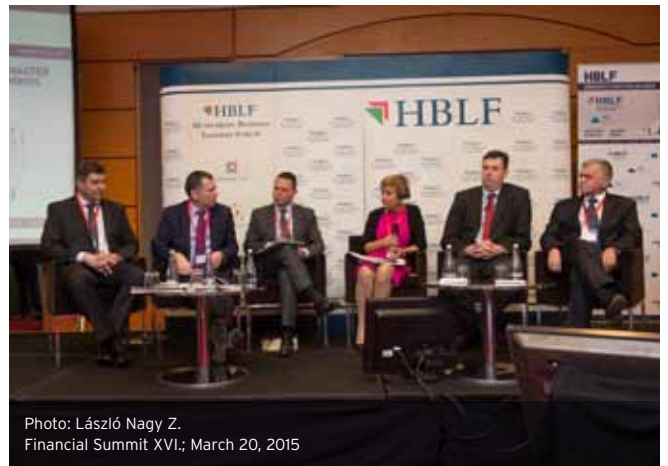
Financial Summit XVI.; March 20, 2015