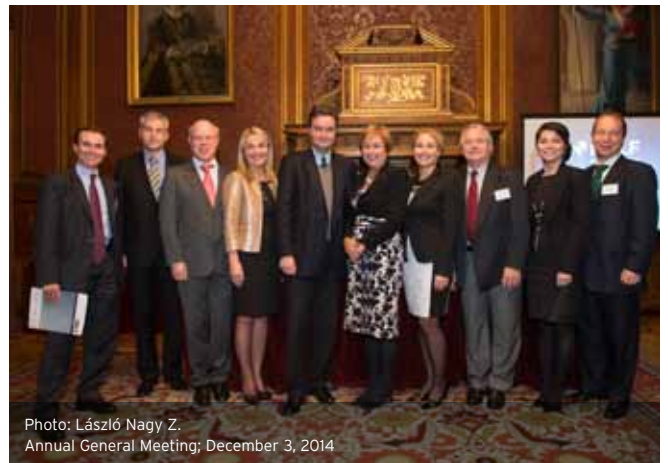
Annual General Meeting; December 3, 2014