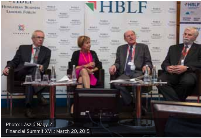
Financial Summit XVI.; March 20, 2015